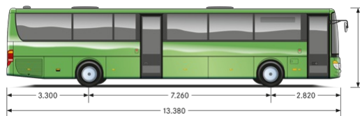
Все размеры в миллиметрах.

Модель MultiClass S 417 LE business имеет самую длинную базу. При длине 13,4 м и багажном отделении объемом почти 7 кубометров он является идеальным решением, например, для использования в качестве школьного автобуса.