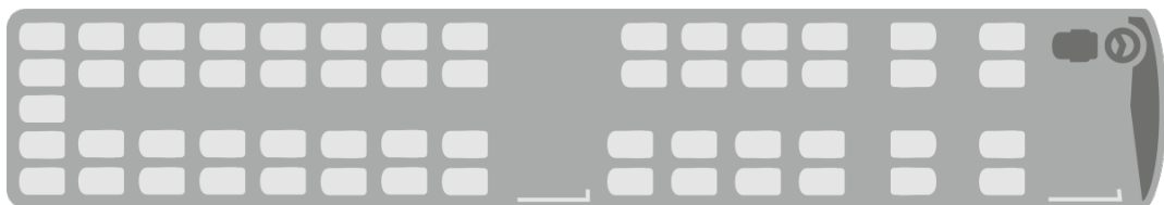
Wariant 2 S 418 LE business - 57 siedzeń