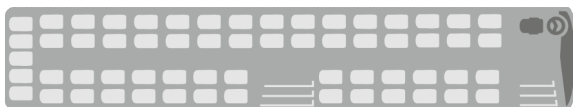
Wariant 2 S 417 UL - 63 siedzenia