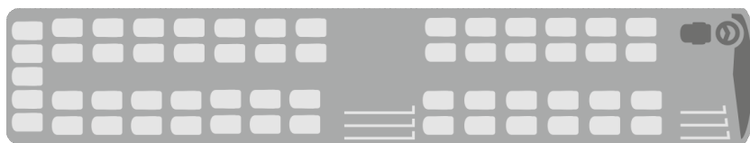
Wariant 1 S 417 UL - 57 siedzeń + WC