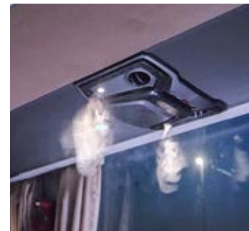
Augmentation de l'approvisionnement d'air frais

→ Les distributeurs de gel hydroalcoolique (à capteur) assurent l'hygiène des mains nécessaire.