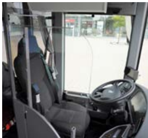
Portes cabine conducteur

→ Les systèmes de filtrage (filtres actifs) avec fonction antivirale filtrent les aérosols les plus infimes.