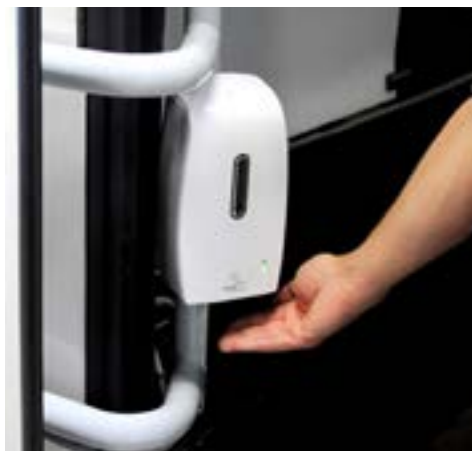
Distributeurs de gel hydroalcoolique

→ Les portes cabine conducteur (en verre ou en polycarbonate) protègent les conducteurs du risque d'infection par gouttelettes.