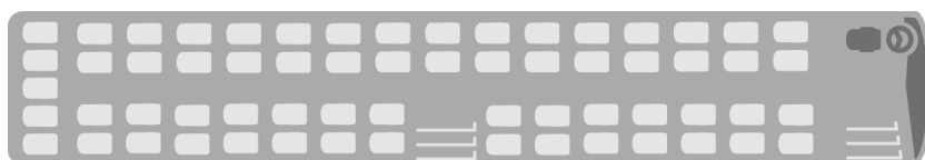
Вариант 1: S 519 HD - 3 звезды - 63 кресла