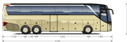
Všechny rozměry v milimetrech.

Model S 516 HDH patří jako „zlatý střed“ – se čtyřmi až pěti místy k sezení navíc v porovnání s modelem S 515 HDH – k nejoblíbenějším autobusům značky Setra. K tomu přispívá také jeho velký zavazadlový prostor, který nabízí místo i pro velká zavazadla.